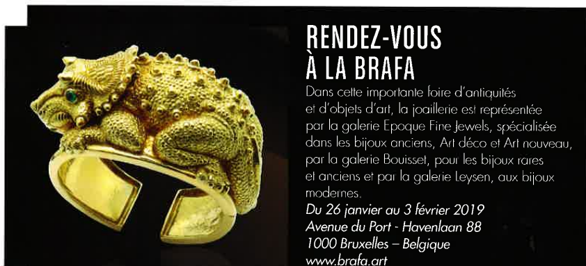
Galerie Bouisset. Bracelet tricératops en or, signé David Webb, vers 1970.