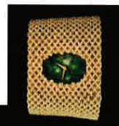
Montre en or jaune et néphrite, Piaget - Circa 1970. Galerie Karry Berreby.

À ce salon du design, la joaillerie est représentée par les galeries Walid Akkad, Karry Berreby, Objets d'émotion Valéry Demure, Sheffield et Suzanne Syz. du 31 janvier au 3 février 2019 Palexpo-Genève - Suisse www.pad-fairs.com