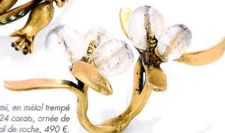
Bague Harumi, en métal trempé dans un bain d'or 24 carats, ornée de perles de cristal de roche, 490 €.