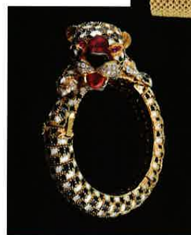
Bracelet en email noir, blanc et rouge, or jaune, diamants et rubis. Frascarolo - Circa 1970. Galerie Karry Berreby.