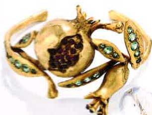
Bracelet Grenade Harumi, en métal trempé dans un bain d'or 24 carats, orné d'une grenade précieuse incrustée de strass Swarovski, 650 €.